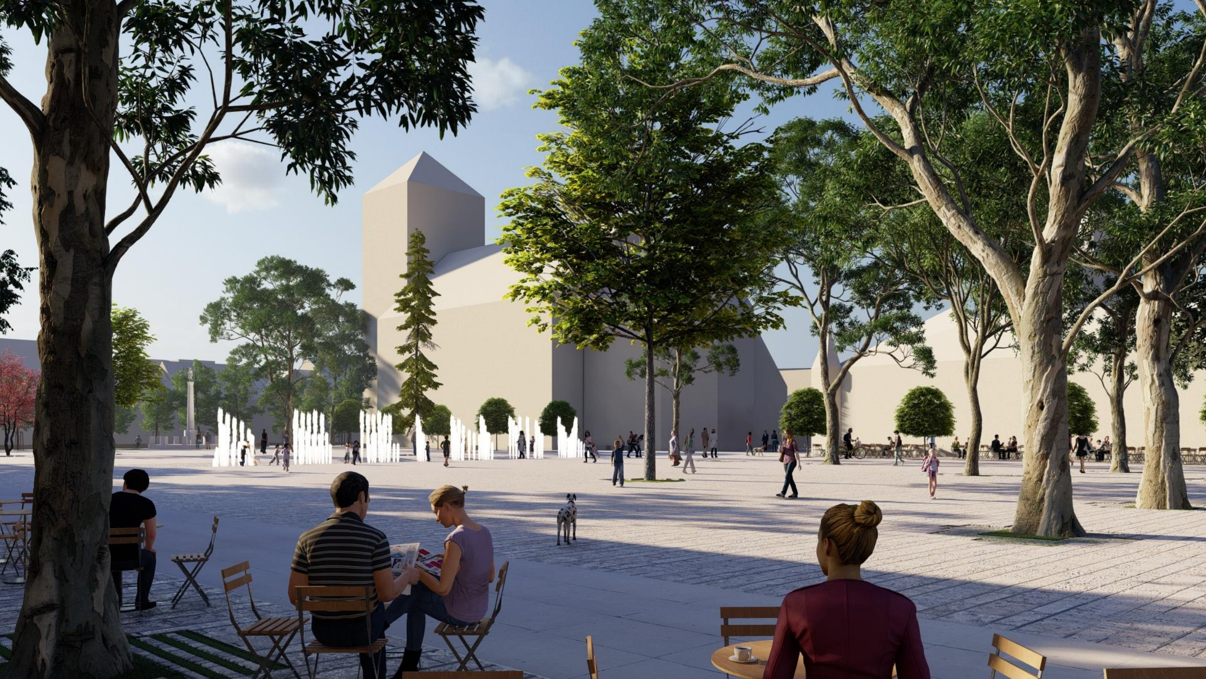
VIZUALIZÁCIA RADNIČNÉ NÁMESTIE

Ostatné priestory Ulicu M.R. Štefánika ponecháme bez výrazných zmien. Pridávame nové stromy a statickú dopravu posúvame aby bola aspoň 5 m od priechodov pre chodcov. Križovatku pri Bille riešime ako priechod pre chodcov v úrovni chodníka. Budova s veľkým potenciálom je budova bývalej základnej školy na Holubyho ulici (6). Zároveň s mestskou knižnicou vytvára druhé kridlo vstupnej brány do mesta. Dnes je budova patriaca mestu bez využitia. Snažíme sa skultivovať priestor za budovou školy, ktorý bol kedysi školský dvor. Zapojiť priestor do mestského života a vytvoriť spoločný vnútroblok pre vedľajšie denné centrum pre seniorov a materské centrum. Pripraviť priestor pre budúce znovu nájdenie funkcie budovy školy z roku 1914.