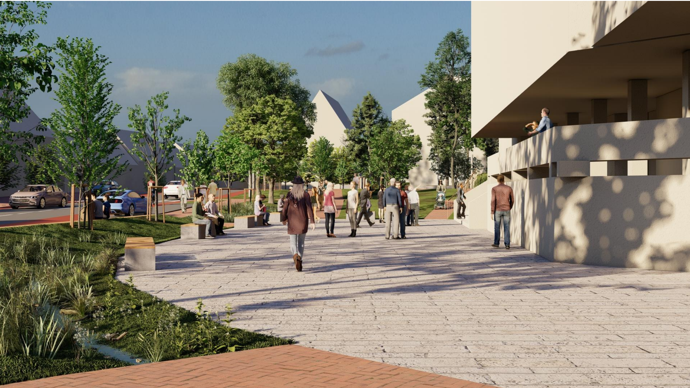
VIZUALIZÁCIA KULTÚRNY DOM