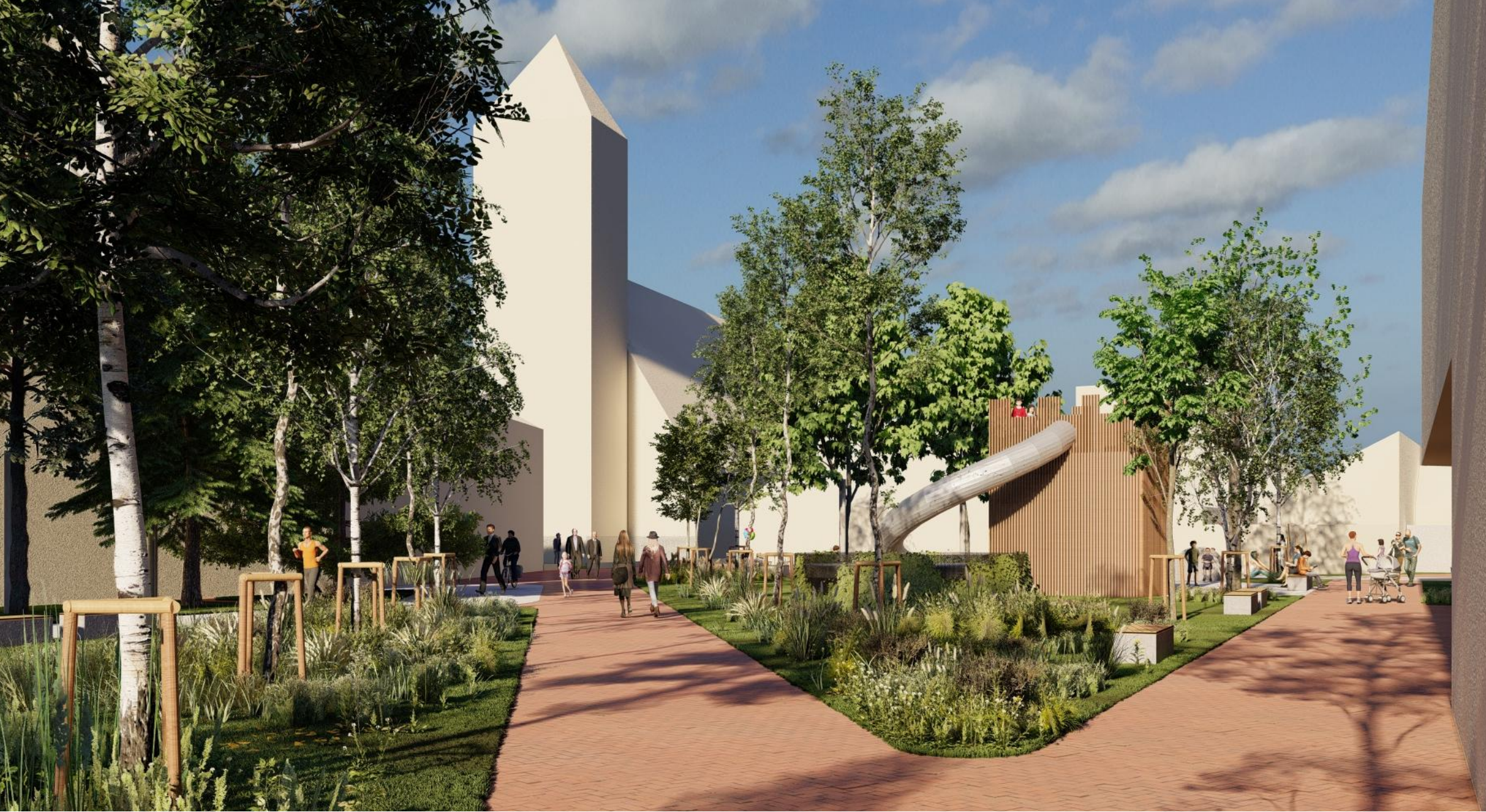
VIZUALIZÁCIA SUCHOŇOVHO NÁMESTIA